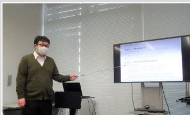
口頭試験に向けて練習中